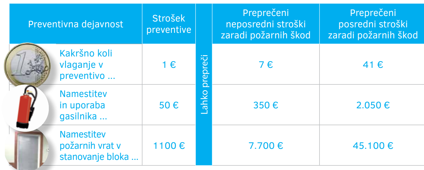
Tabela 2: Pomen požarne preventive

Upoštevajoč razmerje stroškov 1/7/41 lahko ocenimo, da bi ob požaru v namišljenem 200 m 2 velikem objektu v primeru, da sprinkler ni vgrajen, nastala škoda, ki bi znašala 14.000 € direktnih in 82.000 € indirektnih stroškov. Skupna škoda bi znašala 96.000 €, kar je realna ocena. V primeru nastanka požara lahko gorenje že po 5–10 minutah vodi v požarni preskok. Požar je v celoti razvit, temu primerna pa je tudi požarna škoda.