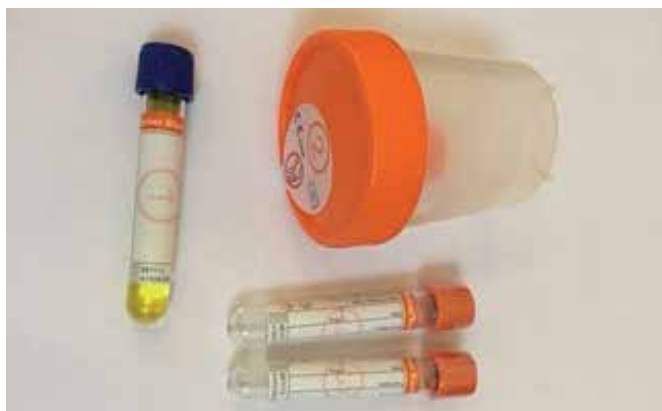
Slika 2 (spodaj): Greinerjev Bio-One sistem za odvzem slin

Vzorci slin, ki pridejo v laboratorij, se lahko najprej preiščejo z laboratorijskimi imunokemijskimi postopki. Pozitivni rezultati presejalnih testov se morajo preveriti z neodvisnim kromatografskimi tehnikami (npr. GC/MS, LC/MS/MS). Laboratoriji, ki opravljajo številne presejalne teste, zaradi ekonomičnosti opuščajo imunokemijske presejalne postopke in jih zamenjujejo z uvedbo validiranih kromatografskih metod, s katerimi ciljano zasledujejo psihoaktivne snovi, ki se najpogosteje zlorabljajo 6,7 .