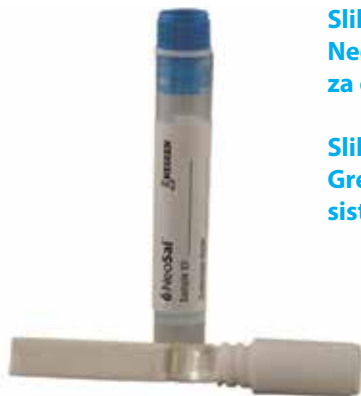
Slika 1 (levo): NeoSal™ – Sistem za odvzem slin